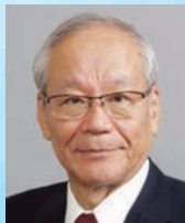
横倉義武共同代表